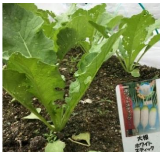
『ホワイトスティック』という品種の大根。小振りな大ききなのが特徴です。

今月は白菜に初挑戦!利用者さんの希望で白菜の種をまき、芽が出始めました。他にもキャベツやダイコンといった冬・春野菜の栽培にもチャレンジしています。