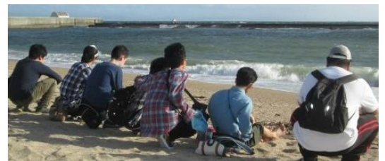
オレたち青春真っ只中!