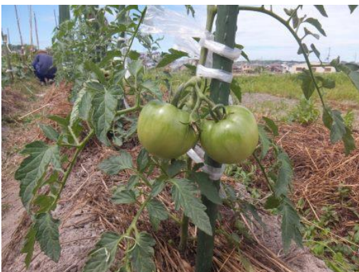
夏野菜、トマト、きゅうり、ピーマン日毎に大きくなっていますよ♪