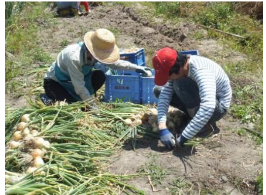
手がしびれる〜くらい切りまくりました!

今月10日、台風3号が来る!との天気予報に大慌てでたまねぎの収穫を行いました。深く埋めすぎたものは引き抜くのも一苦労でした。引き抜かれたものはネギの部分と根を切り、土のついた外の皮をむき、つるつるのきれいな状態にしました。福祉の広場のKさんの紹介で高鷲学園、保育園、わくわくクラブのOさんが紹介してくれた観心寺保育園、わくわくクラブの保護者様、南板持のデイリーヤマザキさんは二つ返事で販売をOKしてくれました。ネットに関わって下さるたくさんの方々も「10個持っていくね!」など声をかけ販売に協力してくださっています。今現在、収穫の半分程が売れました。みなが心をこめて作った野菜を、喜んで食べていただけるのはほんとうに嬉しいことです。