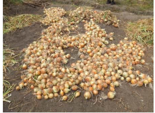
(推定1トン以上!?) たまねぎの大収穫!!